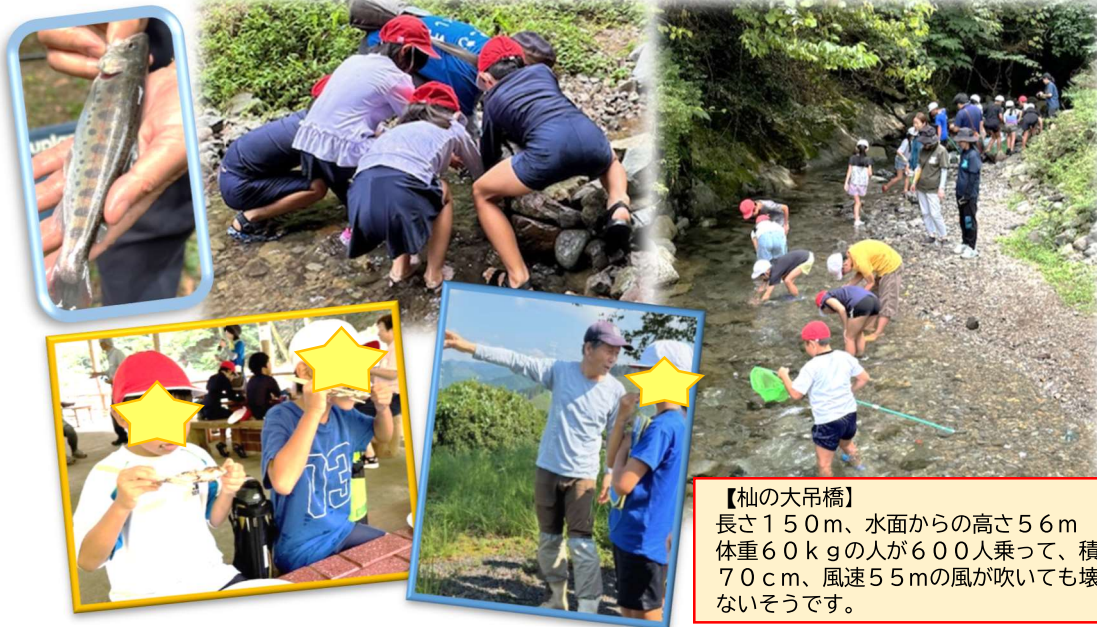
【杉の大吊橋】 長さ150m、水面からの高さ56m 体重60kgの人が600人乗って、積雪70cm、風速55mの風が吹いても壊れないそうです。

本校児童生徒のアンケート調査からも、家庭学習時間（県の平均時間を下回る）や、メディアと向き合う時間（テレビ、YouTube等の視聴時間、ゲームをする時間、SNS等の使用時間）の長さ（県の平均時間を上回る）は大きな課題です。再度、各家庭でも話題にし、子どもの生活を見守っていただきますようお願いいたします。